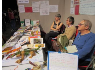
Fougères Novembre 2015