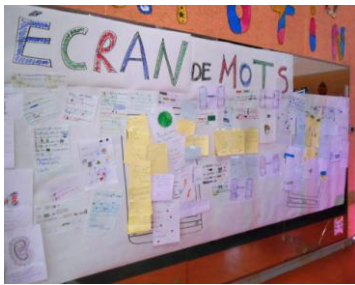
Orléans Mai 2015