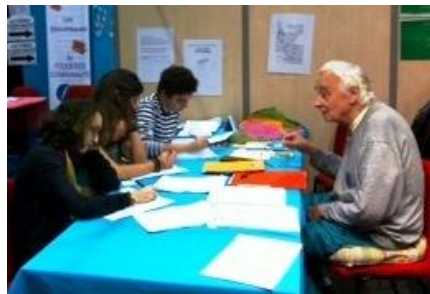
Salon de Fougères