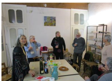
Pot de l'Amitié à l'AG des Associations Novembre 2017