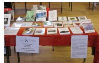
Salon de Veigné 1 er Octobre 2017