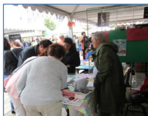
Rentrée en fête Orléans Septembre 2017