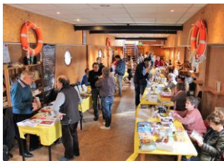
Forum du livre 2018 « Ecrire & Lire » Triel-sur-Seine