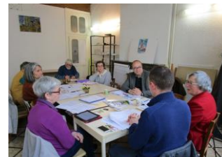
AG de VEF Mars 2018