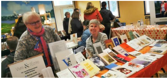
Le salon de Sandillon