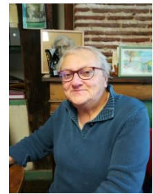
Rencontre des Associations Orléans au Centre Recouvrance